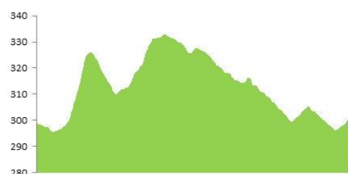
Výškový profil kategorie U15/U18/Z15/Z35