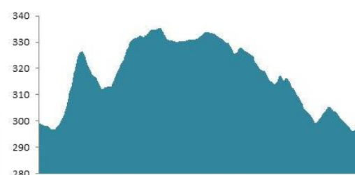
Výškový profil kategorie M18/M30/M40/M50